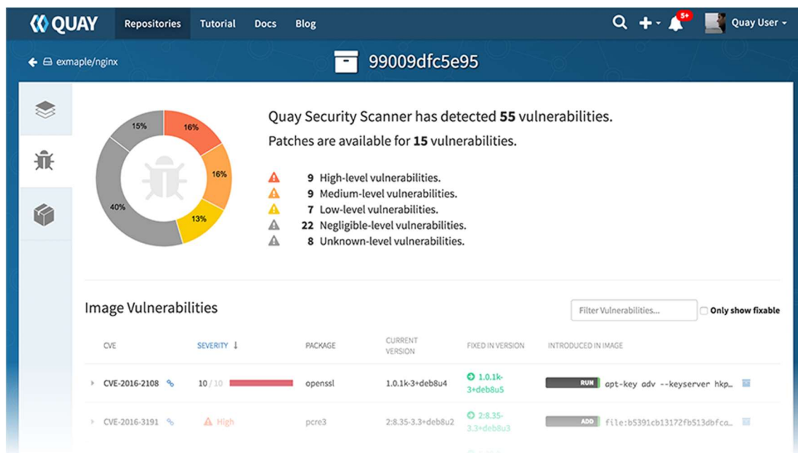
Abbildung 2: Docker Image Scanning – Red Hat Quay, Quelle: quay.io

Beispiele für Tools: Anchore Engine, Red Hat Quay, Black Duck OpsSight, Aqua Security, Twistlock